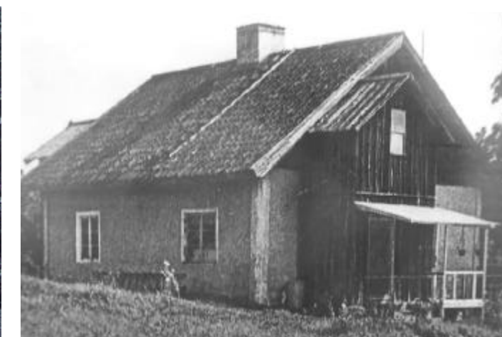
Delar av Jungfrukrogen användes för att bygga Finsta Dragonboställe - även kallat Bostället. 1973 revs också det.

Mållberg halshöggs lördagen den 22 januari 1842 i Bro.