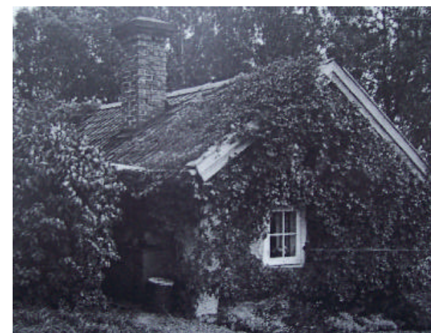
Skräddarkojan även kallad Finstaberg var bebott till 1958 och revs 1973.

Onsdag 26 november kl 19.00 i observatoriet vid Kvistaberg. Om himlen är mulen visar vi i stället en dataanimation. Antalet deltagare är begränsat. Ring Börje Sandén och anmäl ditt intresse, 08 - 582 405 15