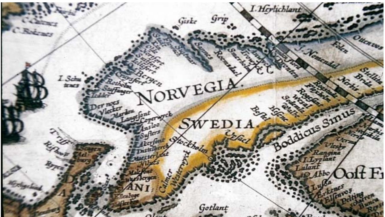
Karta från 1598 - en s.k. Carta marina , en efterföljare till s.k. Portolaner (hamnkartor) Visar endast ländernas kustlinjer och hamnar.

Kartan här nedan är en s.k. carta marina , en "havskarta", som avser att beskriva länders kuster och deras vid kusten belägna orter. På 1500-talet kände man naturligtvis inte till landhöjningen i nord. Kartan ritades på uppdrag av holländska köpmän som ville upprätta handelsförbindelser med norra Europa. Kartografen Barent, som egentligen var lots åt holländska handelskepp, har aldrig själv varit i Östersjön. Han gjorde tre resor längs Nordsjön, Norska havet och Barents hav (!) med uppdraget att försöka hitta en isfri passage norr om Ryssland för att därmed finna en sjöväg till Kina och Indien. Han dog under sista resan och kartan sammanställdes i hans namn av andra med hjälp av det insamlade materialet.