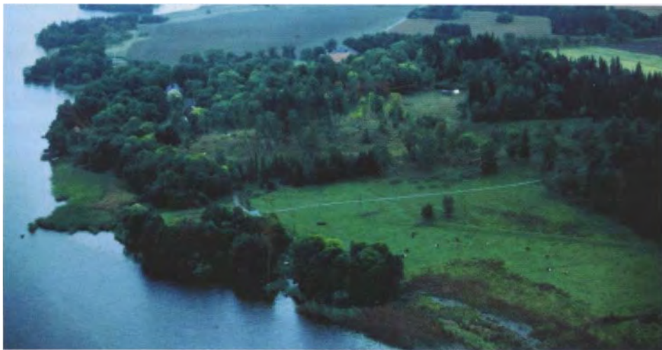
Vid Sighildsberg genomfördes undersökningar som gav nya kunskaper om Forn-Sigtuna.

mans med Riksantikvarieämbetet för att skapa samverkan mellan yrkesverksamma arkeologer och amatörer, som vi idag gärna kallar hembygdsarkeologer, har Sandens tagit till sig på samma sätt som Arbetsgrupp Långhundraleden har varit en viktig part. Det började 1981 med en liten undersökning av Rösaring. Här hade upptäckts en unik väganläggning som gick mellan en husgrund och en storhög. Grävningar under två år