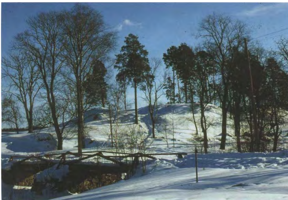
S:t Eriks slott vid Almare-Stäket har undersökts på initiativ från UKF.