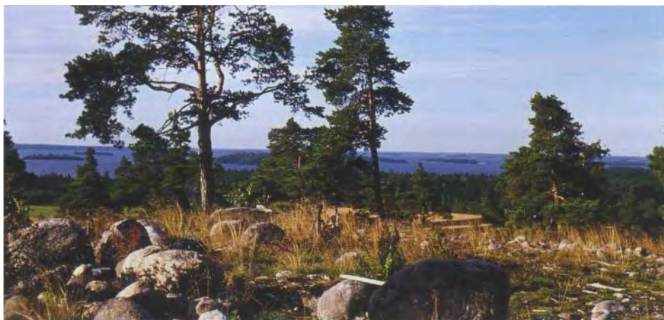
Gravfältet vid Rösaring i Låssa är skönt beläget med utsikt Mälarsikt.