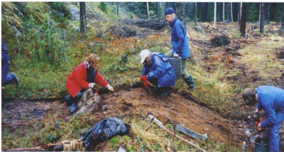
Jordvallen vid Draget undersöks.