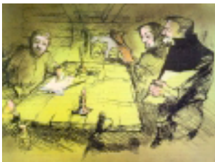
Tibble gästgivargård i Kungsängen 1743.

Grottan beskrivs i Jan Fridegårds vikingaroman Trägudars land.